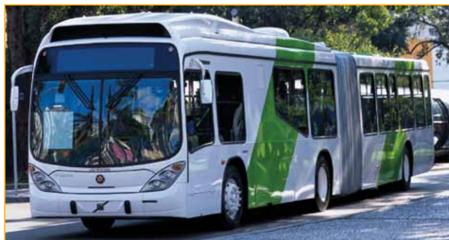
Voorbeeld van 'n hoofdiensbus