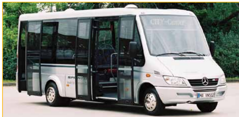
Voorbeeld van 'n toevoerdienbus

Reisgelde sal bekostigbaar wees en vergelykbaar met dié wat tans vir busse en minibustaxi's betaal word.